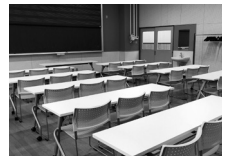
研修室1 (旧音楽教室)