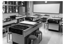
研修室2 (旧家庭科室)