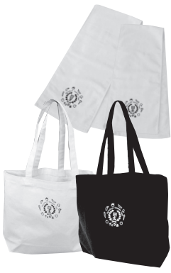
マフラータオル & トートバッグ

援農ボランティアは、ご自分の都合の良い日時・時間帯で活動できるので、短時間でも、間が空いても、気軽にご参加いただけます。青空の下、気持ちいい汗を流せますよ！気になったら、いつでもさとぴあにお問い合わせてくださいね。