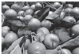
摘果した小さなリンゴの実