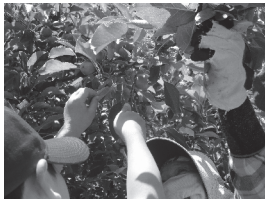
リンゴの摘果体験の様子

皆さん、地元産の果物についてご存知でしょうか、果樹農園で実際収穫した経験のある人はあまり多くないと思います。6月から始まったリンゴを育て収穫する体験講座は、4回にわたる生産農家の人から指導をうけて折々の作業を行います(7/26 徒長枝切り体験 ※裏面参照)。また7月11日にはブルーベリーの摘み取り体験(※裏面参照)をし、それを利用して料理を作ったり(7/30 ランチプレート料理講座 ※裏面参照)、お菓子を作ってみたり(8月下旬に開催)します。自分の手で収穫した果実の味は一味違いますし、この機会に果樹農業を知るきっかけにもなればと思っております。その他に、はつらつシニア世代を対象にした講座(7/15 3分教室 ※裏面参照、8月下旬 歌声喫茶)など予定しております。請うご期待！