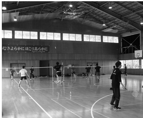
主にバスケットボールやバドミントンなどご利用されています

さとぴあの多目的ホールは旧体育館。木目のきれいな床が自慢です。バスケットボール・剣道・エアロビクス(鏡あります!)などに利用できます。週末にお子さんと鬼ごっこ!という使い方も大歓迎です。バドミントンはコート4面がとれます。支柱やネットも備えており、ミニテニスにも使用できます。多目的ホールを借りる方には、ラケット(4本)とシャトルを無料で貸出しています。事務所までお声がけください。また、さとぴあの研修室を、サークル活動や講座などにご利用ください!空き状況確認・予約はインターネット上の秋田市公共施設予約システムから、またはお電話でお問い合わせください。