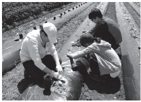
ナスの定植をするボランティアの皆さん