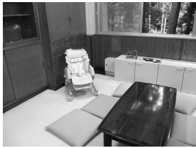
授乳室やおむつ替え、ハイハイコーナーを設置