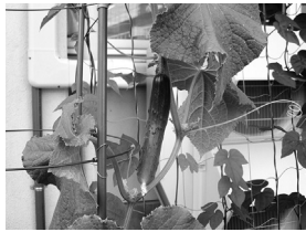
きゅうりやゴーヤなどを育てています

小さなカエルが遊びに来たり、オニヤンマがパトロールに来たりと、毎日いろいろな表情を見せてくれるグリーンカーテン、ご来館の際は少しだけご注目いただければと思います。