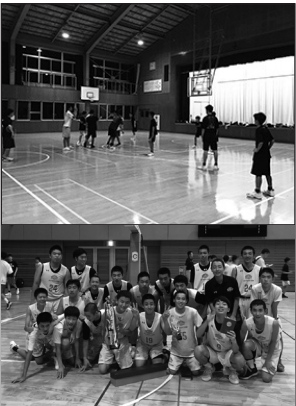
2019年8月 山形遠征で優勝!