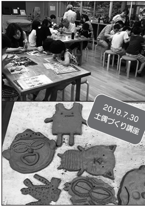
2019.7.30 土偶づくり講座 土偶づくりの様子と参加者の作品