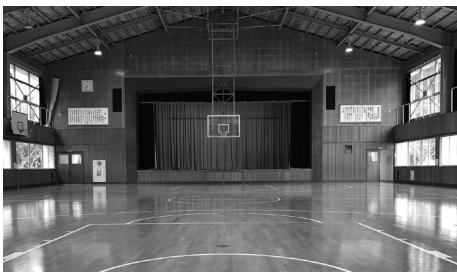
多目的ホール (旧体育館)

皆さん、さとびあに来られて「地域未来室」を気軽に覗いてみてください。そして「上新城マップ」にどんな情報でも寄せてください。お待ちしております。