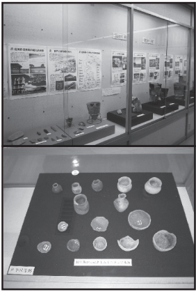
縄文時代の資料展示