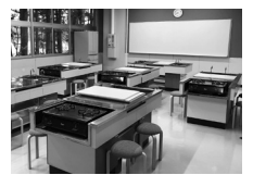
研修室2(旧家庭科室)