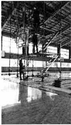
LED 照明の切り替え工事

この状況から、さとぴあでも照明を段階にLEDへ切り替えていくことにし、第一次工事として、先月末に3カ所をLEDへ切り替えました。水銀灯装置が供給されないため既存の照明で切れたままの所がありますが、以前より多少明るくなったと感じます。水銀灯のすべてをLED照明にするためには少々時間がかかるので、利用される皆さまにはご不便をおかけしますが、ご理解をいただけますようお願いいたします。