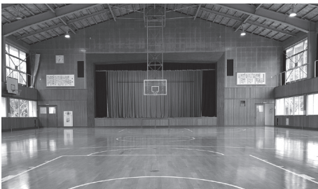
多目的ホール (旧体育館)