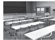
研修室1(旧音楽教室)