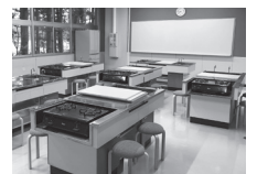
研修室2(旧家庭科室)