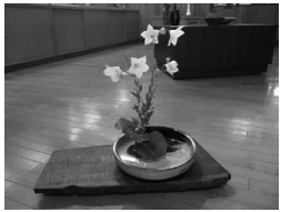
さとぴあ展示スペースでミニ花展